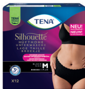
NEU: TENA Silhouette Plus Black