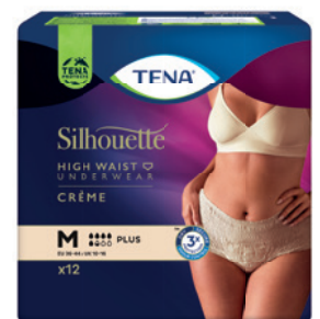
TENA Silhouette Plus Crème