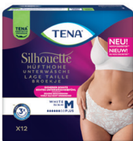
NEU: TENA Silhouette Plus White